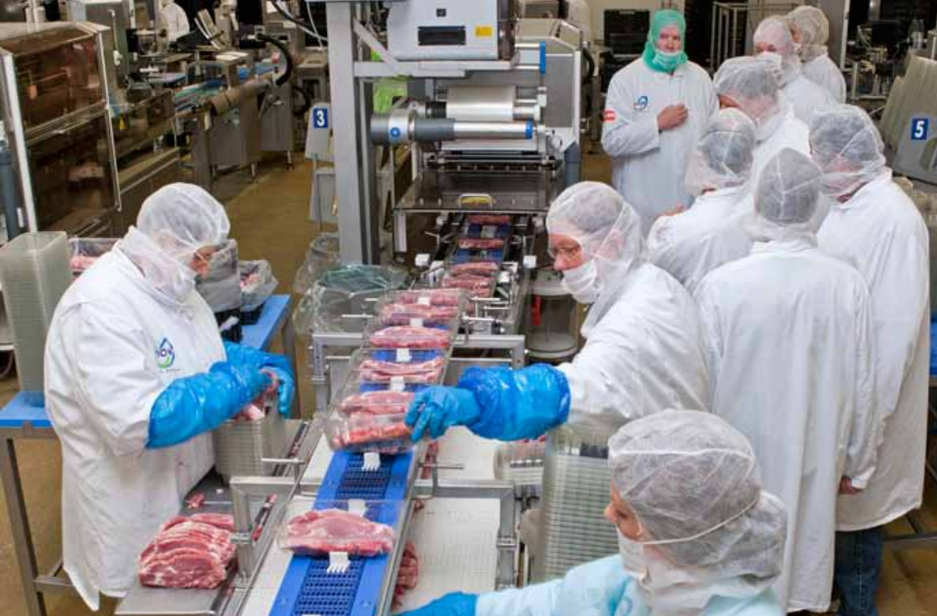
Tijdens de rondleiding zien de varkenshouders hoe het vlees wordt verpakt voor de winkels.