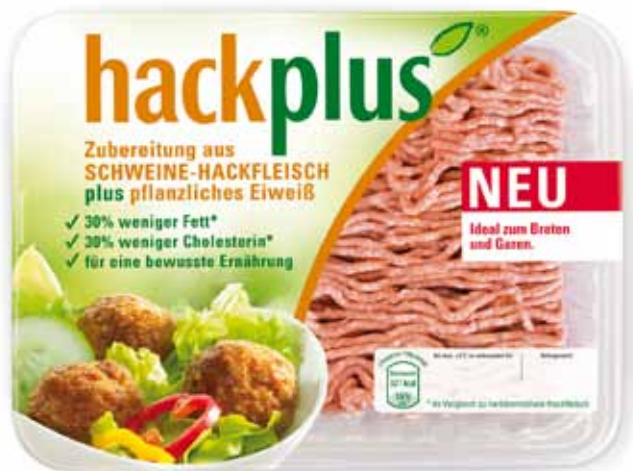
Hybride product op de Duitse markt Hackplus, gemaakt van gehakt en plantaardige eiwitten.

drogen of koken. Er zijn ook mogelijkheden om afwijkende geur te maskeren en te camoufleren met kruiden.”